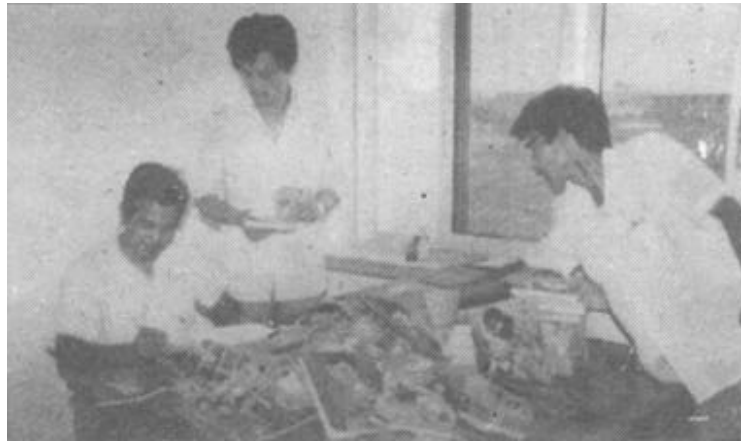
△东营区宣传部、公安局等六个单位联合对售书摊点，录相放映点进行了清查，收缴非法出版及格调低下书刊900余册，查缴部分黄色录相带。图为宣传部人员在登记收缴的书刊。

如何把这一活动进一步引向深入？市竞赛委员会要求：一是要加强领导，以点带面，抓典型，树标兵。二是要充分发挥共产党员的先锋模范作用，把优质服务重点放在基层。三是抓好廉政建设，对那些质量不合格、不文明的单位进行暴光，不合格者挂黑牌，并限期改正。(纪荣起)